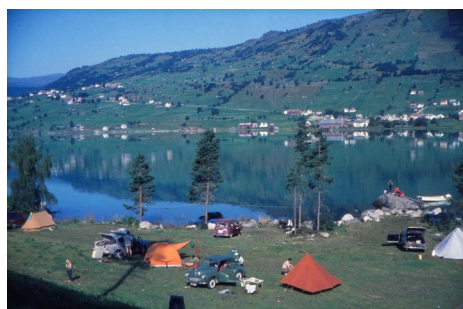
Det har blitt drive campingplass på Lyngmo nesten heilt sidan oppstarten i 1965.