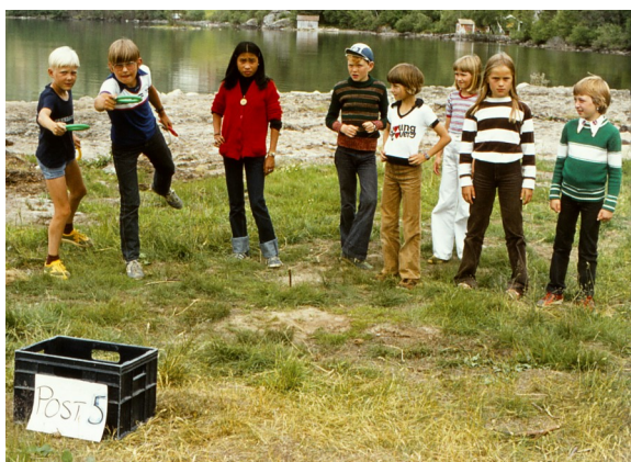
Ulike typar sporløp har alltid vore ein slager på leir!