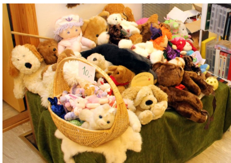
Flotte bamsar som er klar for ein ny eigar

- Har du ting du ynskjer å gi til loppemarknaden? Ta kontakt med oss på 57684366