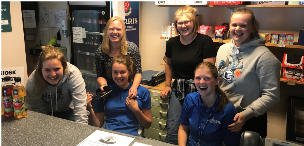
Nokre av årets fantastiske sommarvikarar!

Turistar er som folk flest. Du har dei som ikkje har bestemt seg for kor dei skal sove før klokka er 02.00, og du som har vakt vaknar litt forfjamsa av vakttelefonen som ringer og må hive på deg klede i full fart for å sørge for at våre venner får nokre timar på puta. Du har guiden som må ty til google translate for at du skal forstå at nokon i reisefølget har bursdag, og du må fikse «anything extra, just anything». Du har dei skjønne norske femåringane, som skal ha den «samme isen som istad» og blir litt skuffa fordi du ikkje hugsar kva is dei kjøpte sist gong dei var i kiosken. Du har dei som er litt for raske ut dørene, og gløymer både sko og bilnøklar og kva som helst i grunn. Det er utruleg kva folk kan gløyme. Du har dei som muligens kanskje burde tatt eit engelskkurs. Du har den takknemlige gjengen, som gjerne blir ei natt eller tre fordi dei har komme til «paradis».