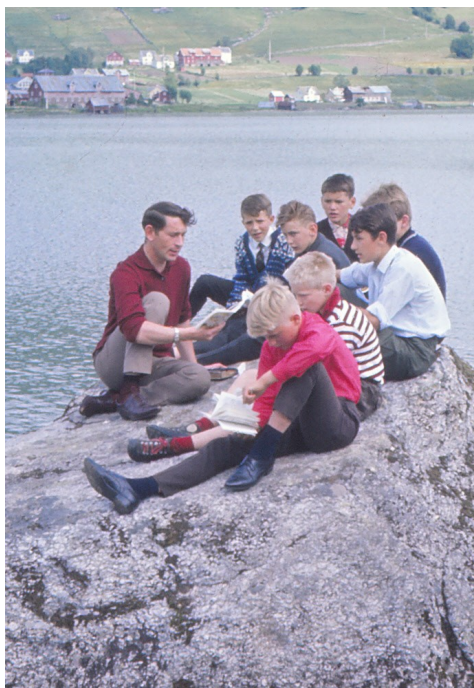
Steinen dei sit på er framleis på Lyngmo. Kanskje de kjenner igjen denne gjengen..?