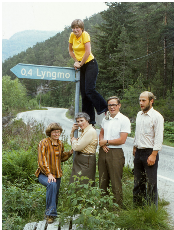
Nokon som har funne vegen til Lyngmo! Kanskje dei er klare for leir?